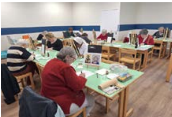
Initiation à l'écriture d'une icône